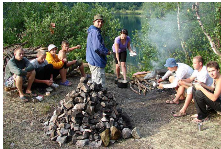
Ужин на озере Кардывач